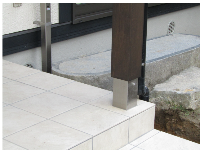
装飾柱受けストレート 使用例