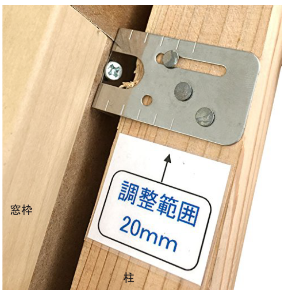
エイトツ一枠材金具 使用例