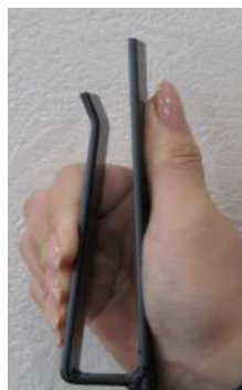
【絞り込んでいる様子】